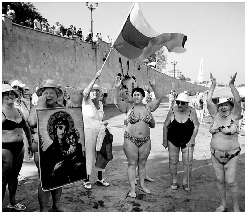
Ruské ženy v Sevastopole vítajú ruské lode, vracajúce sa z operácií pri gruzínskom pobreží. Gruzínka vyprevádza ruských vojakov, sťahujúcich sa z oblastí pri Tbilisi. Na plagáte má nápis Bombami Gruzínsko na kolena nedostanete.

Aj keď Tbilisi ostro proti takto chápanému „nárazníku“ protestuje, nemá bez podpory